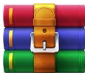
【务必解压】 申报客户端.rar